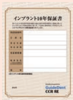
インプラント10年保証書

ガイドデント認定歯科医療機関によってインプラントの治療が完了した時点で、患者さまに「インプラント10年保証書」が発行されます。下記のような場合、保証書記載の保証限度額を上限に無償で再治療を受けることができます。